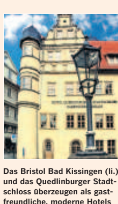
Das Bristol Bad Kissingen (li.) und das Quedlinburger Stadtschloss überzeugen als gastfreundliche, moderne Hotels