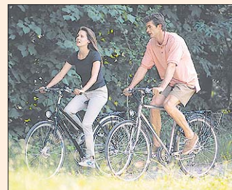
Radtour im Grünen

Das Emsland ist ein ideales Reise-Ziel zum Abschalten, Auftanken und Aktiv-Sein, denn es verfügt über weite Naturräume, idyllische Orte und einzigartige Sehenswürdigkeiten. Ein gut ausgebaut Radwegsystem und rund 1100 Kilometer ausgeschilderte Reitwege machen das Emsland gerade für Reiter und Radfahrer zum Paradies (weitere Informationen unter www.emsland-touristik.de ).